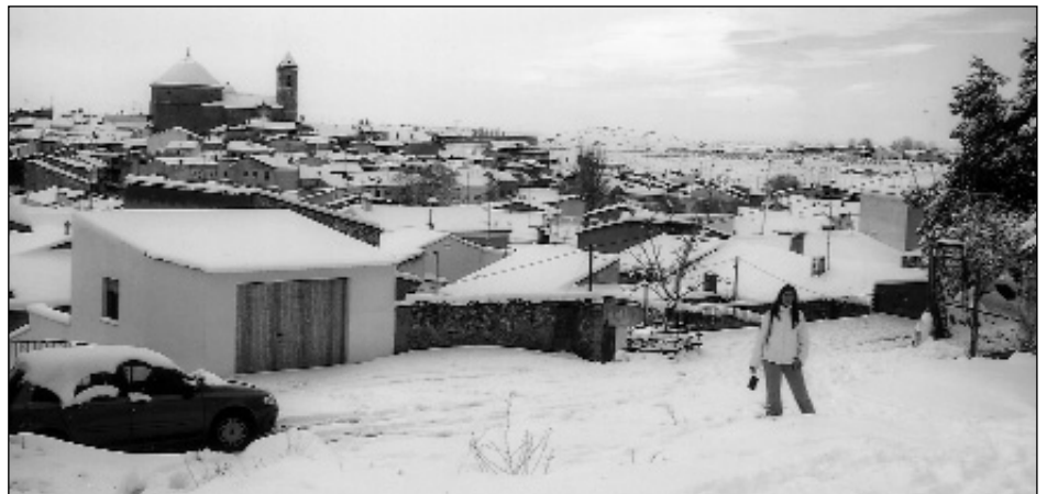
Alborea, nevada de las navidades 2005

Cruce de ctra. de Zulema Tel. 967 477 036 ALBOREA